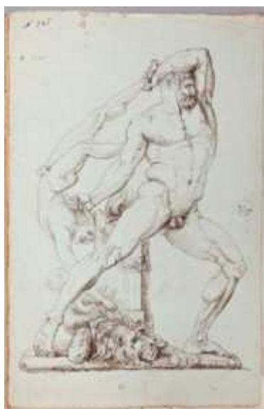
Ercole e Lica

In particolare, l'esposizione individua due principali percorsi di lettura dell'opera canoviana: il rapporto con la scultura antica delle collezioni romane e quello con i personaggi storici e della cultura del suo tempo. Del primo fanno parte i disegni per tre importanti opere realizzate: la Venere Italica , il Creugante e Damosseno e l' Ercole e Lica . Della seconda i disegni per i monumenti e le sculture di personaggi quali Napoleone Bonaparte , Maria Luisa d'Asburgo , George Washington , Vittorio Alfieri , Orazio Nelson , Paolina Borghese .